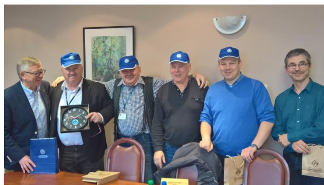
Zwycięzcy konkursu z nagrodami

Z przyjemnością informuję, że nasz pierwszy SEPIK-owy konkurs historyczny ma swoich zwycięzców. Grupa osób (na zdjęciu) udzieliła prawidłowej odpowiedzi.