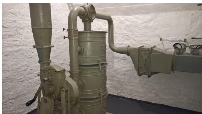
Sprawne urządzenie do filtracji i napowietrzania schronu

Wspólnie z „Odkrywcami” zamierzamy w końcu marca zorganizować wystawę poświęconą historii energetyki na pomorzu środkowym. Ciekawym miejscem wystawy będzie siedziba „Odkrywców” znajdująca się w podziemiach, obecnego hotelu Gromada w Koszalinie przy ul. Zwycięstwa.