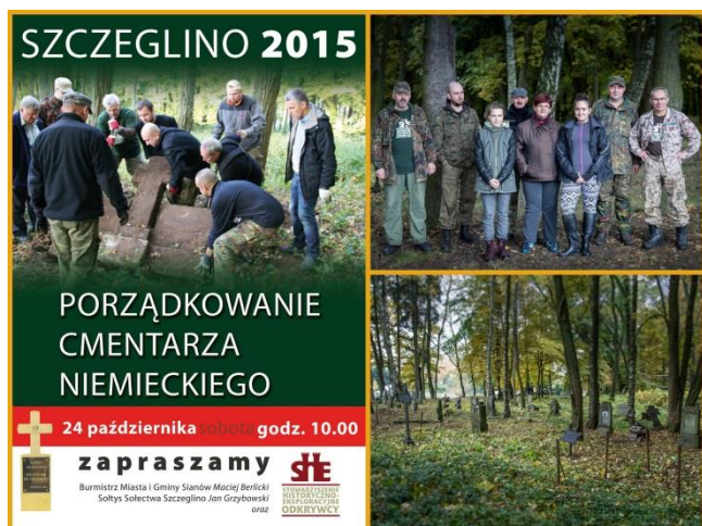
Stowarzyszenie w szlachetnej akcji a z nimi burmistrz Sianowa

lu spotkaniach grup rekonstrukcji historycznej praktycznie w całym kraju. Szyją własne stroje historyczne, kolekcjonują historyczny sprzęt.