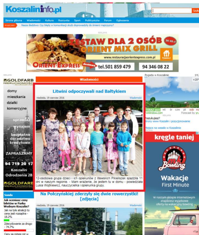
Informacja z ubiegłorocznej wizyty

Nasz oddział od kilku lat uczestniczy w akcji pomocy Polakom na Litwie. Skupiamy się głównie na akcji świątecznej dla polskiej szkoły w miejscowości Pikieliszi pod Wilnem, a ostatnio także organizacji kolonii letnich dla kilkunastoosobowej grupy uczniów tej szkoły. Jako stowarzyszenie działamy z grupą wolontariuszy, podmiotów gospodarczych z Koszalina wspierających akcję finansowo oraz Centralny Ośrodek Szkolenia Straży Granicznej w Koszalinie i Szkołę Podstawową w Sarbinowie. Podjęliśmy decyzje o organizacji kolonii także w tym roku. Zapewniamy uczniom i opiekunom nieodpłatny udział w 2 tygodniowym turnusie oraz transport w obie strony. Także w czasie pobytu zamierzamy zorganizować czas i wycieczki do pobliskich atrakcyjnych miejscowości. Te zadania jeszcze stoją przed nami. Z przyjemnością powitamy inicjatywy, propozycje, chęć pomocy członków naszego stowarzyszenia.